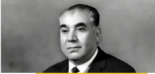
يحيى إسماعيل موسى حمودة

يُعدّ خليل الوزير (أبو جهاد) أحد أبرز الشخصيات الوطنية الفلسطينية التي تركت بصمة لا تمحى في تاريخ المقاومة والنضال من أجل الحرية والكرامة. وُلد أبو جهاد في مدينة الرملة عام 1935، وكان له دور بارز في تأسيس فتح وتنظيم صفوف الوطنية لمواجهة الاحتلال، مساهماً في وضع خطط النضال السياسي والعسكري بإستراتيجية دقيقة. عرف أبو جهاد بالالتزام الثابت بالقضية الفلسطينية، وبالقدرة على القيادة الحكيمة، كما تميّز بشجاعته وإصراره على الدفاع عن حقوق الشعب الفلسطيني. ورغم استشهاداه في عام 1988، يبقى إرثه الوطني مصدر إلهام للأجيال، يعلمهم أن الوفاء للوطن يتطلب تضحية وصموداً لا ينكسر.