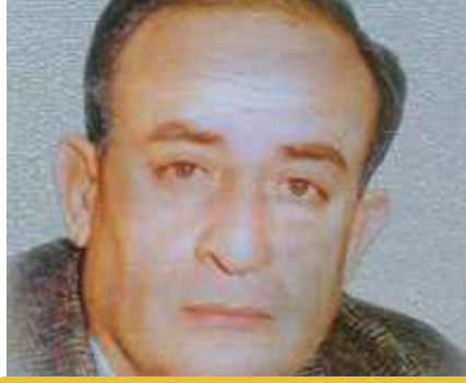
هايل عبد الحميد – أبو الهول: القائد الوفي والمسيرة الراسخة

انخرط يحيى حمودة مبكراً في صفوف الحركة الوطنية الفلسطينية، وذلك أثناء ثورة 1936؛ فقام بجمع التبرعات دعماً للثوار؛ فاعتقل لمدة أربع سنوات، حتى سنة 1940 دون محاكمة؛ وأطلق سراحه بكفالة مالية، واتخذت بحقه إجراءات احترازية؛ حيث منع من مغادرة القدس، وفرضت عليه الإقامة الجبرية؛ ونتيجة هذه القيود شل نشاطه السياسي في حينها. التحق في الثلاثين من عمره بكلية الحقوق بالقدس، وحظرت عليه سلطات الانتداب البريطاني مواصلة الدراسة؛ وعقب زوال الحظر، التحق بالجامعة الأمريكية في بيروت، وتخرج منها عام 1943، بحصوله على إجازة المحاماة، فعاد إلى القدس، انتقل إلى مدينة رام الله بعد وقوع مجزرة دير ياسين في 9/4/1948، وأصدر صحيفة "الهدف"، رافضاً آنذاك الانتماء لأي حزب سياسي؛ لإيمانه الشديد بضرورة توحيد جهود الجبهة الوطنية الفلسطينية في مقاومة الاستعمار. بادر وآخرون إلى تأسيس "الجبهة"، وهي كتلة سياسية ذو صبغة يسارية. في العام (1964) طلب أحمد الشقيري من يحيى حمودة ورفاقه الانضمام للمنظمة؛ فقبل الطلب بالموافقة، على أن تكون القرارات، التي تتخذها المنظمة، جماعية والقيادة جماعية؛ وفيما بعد جرى إعادة تشكيل اللجنة التنفيذية لمنظمة التحرير الفلسطينية، وانتخب يحيى حمودة رئيساً لها؛ ولم يدم طويلاً في منصبه؛ إذ قدم استقالته في العام 1969، وترأس المجلس الوطني الفلسطيني.