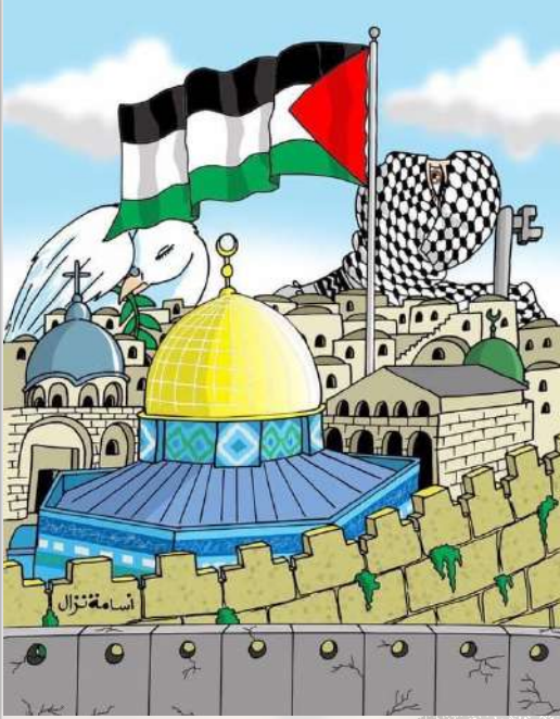
لوحة النقيب/ اسامة نزال