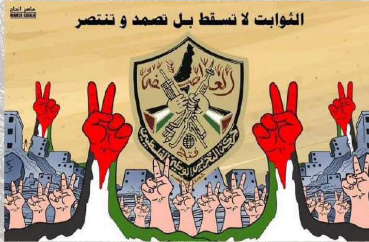
لوحة الفنان/ ماهر الحاج / لبنان