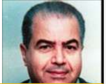
فخري العمري – أبو محمد: رمز الإخلاص والعطاء الوطني

يُعتبر صلاح خلف (أبو إياد) أحد أبرز قادة الحركة الوطنية الفلسطينية، وأحد مؤسسي فتح، حيث لعب دوراً محورياً في تنظيم صفوف المقاومة الفلسطينية وإعداد الأجيال الشابة للمشاركة في النضال من أجل الحرية والاستقلال. عرف أبو إياد بالحنكة السياسية والقدرة على التخطيط الاستراتيجي، كما تميز بالالتزام الثابت بالقضية الفلسطينية وروح التضحية في سبيل الوطن. لقد كان نموذجاً للقائد الذي يجمع بين الشجاعة والإصرار، وبين الحكمة في اتخاذ القرارات وحماية حقوق شعبه.