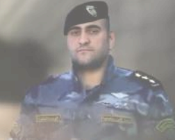
الشهيد البطل الرائد رشيد علي شقو