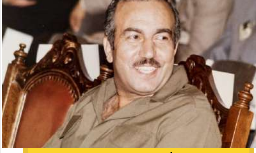
خليل الوزير – أبو جهاد: رمز العطاء الوطني

يُعدّ خليل الوزير (أبو جهاد) أحد أبرز الشخصيات الوطنية الفلسطينية التي تركت بصمة لا تمحى في تاريخ المقاومة والنضال من أجل الحرية والكرامة. وُلد أبو جهاد في مدينة الرملة عام 1935، وكان له دور بارز في تأسيس فتح وتنظيم صفوف الوطنية لمواجهة الاحتلال، مساهماً في وضع خطط النضال السياسي والعسكري بإستراتيجية دقيقة. عرف أبو جهاد بالالتزام الثابت بالقضية الفلسطينية، وبالقدرة على القيادة الحكيمة، كما تميّز بشجاعته وإصراره على الدفاع عن حقوق الشعب الفلسطيني. ورغم استشهاداه في عام 1988، يبقى إرثه الوطني مصدر إلهام للأجيال، يعلمهم أن الوفاء للوطن يتطلب تضحية وصموداً لا ينكسر.