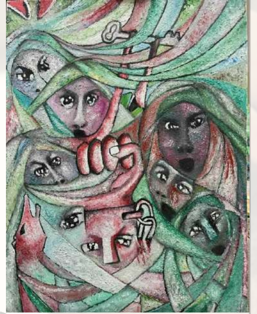
لوحة العقيد/ خالد رسلان