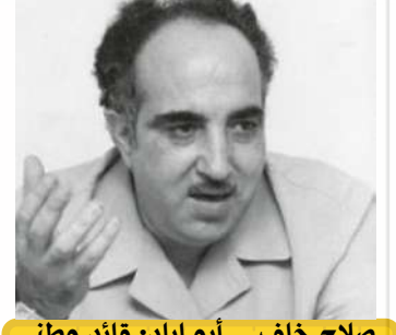
صلاح خلف – أبو إياد: قائد وطني ورمز المقاومة.

يُعدّ هايل عبد الحميد (أبو الهول) من أبرز القادة التاريخيين في مسيرة النضال الوطني الفلسطيني، وأحد مؤسسي حركة التحرير الوطني الفلسطيني "فتح"، حيث كان رمزاً للانضباط التنظيمي والالتزام الثابت بمبادئ الثورة الفلسطينية. وُلد أبو الهول في مدينة صفد عام 1937، وشهدت حياته محطات نضالية حافلة بالعطاء، تميّز فيها بالصدق والإخلاص والإيمان العميق بعدالة القضية الفلسطينية. تولى عدداً من المناصب القيادية، وأسهم في بناء المؤسسات الأمنية والتنظيمية للحركة، محافظاً على نهج الانضباط والوحدة في العمل الوطني. عُرف أبو الهول بحكمته وشجاعته وحرصه الدائم على وحدة الصف الفلسطيني، وظل حتى استشهاداه عام 1991 مثلاً للقائد المخلص الذي كرّس حياته من أجل وطنه وشعبه.