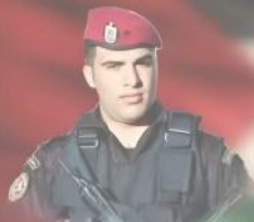
الشهيد البطل الرائد حسين نصار